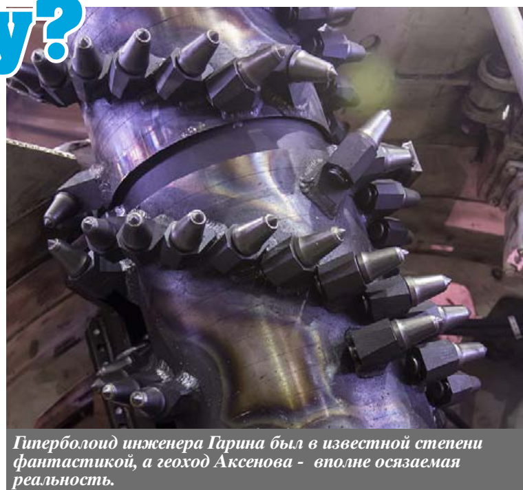
Гиперболоид инженера Гарина был в известной степени фантастикой, а геоход Аксенова - вполне осязаемая реальность.

Аналогичная ситуация сложилась и в подводном флоте. Гребной винт открыл такую возможность. Динамика подводных аппаратов развивается стремительно, особенно в нашей стране. А вот в горном деле все не так! Мы опустили под землю строительную технику, которая хорошо работает на поверхности. Это бульдозеры, тракторы. Мы делали проходческие комбайны