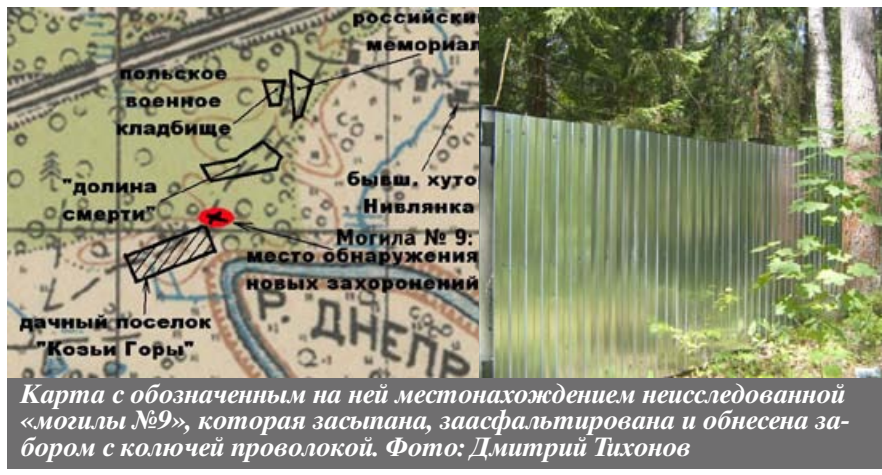
Карта с обозначением на ней местонахождения неисследованной «могила №9», которая засыпана, заасфальтирована и обнесена забором с колючей проволокой.

Некоторые исследователи считают, что «могила №9» является ключом к разгадке Катынской трагедии. Почему 15