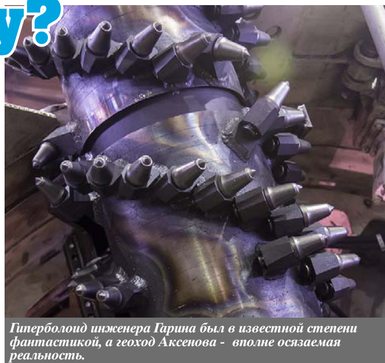
Гиперболоид инженера Гарина был в известной степени фантастикой, а геоход Аксенова - вполне осязаемая реальность.

Аналогичная ситуация сложилась и в подводном флоте. Гребной винт открыл такую возможность. Динамика подводных аппаратов развивается стремительно, особенно в нашей стране. А вот в горном деле все не так! Мы опустили под землю строительную технику, которая хорошо работает на поверхности. Это бульдозеры, тракторы. Мы делали проходческие комбайны