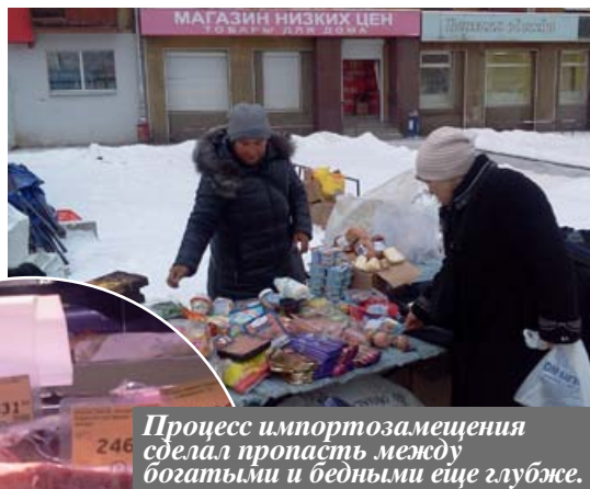
Процесс импортозамещения сделал пропасть между богатыми и бедными еще глубже.

А пока элита с жиру бесится в центре, простолодины на окраинах выстраиваются в очередь за продуктами, снятыми крупными торговыми сетями с реализации из-за истечения срока годности. Народ здесь скапливается совсем не тот, что в элитном супермаркете, о прошутто они не слышали, а вот сыр с плесенью (настоящей) - да, ели. Такие «деликатесы» приобрести за дешево можно в нескольких райо-