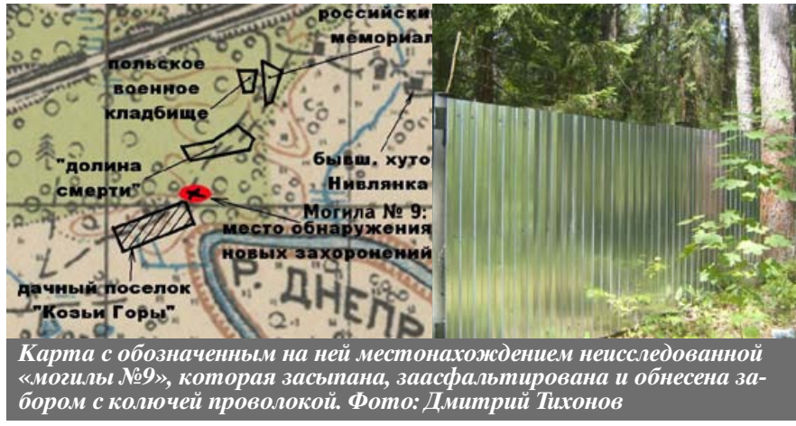
Карта с обозначением на ней местонахождения неисследованной «могила №9», которая засыпана, заасфальтирована и обнесена забором с колючей проволокой.

НВ! КСТАТИ, на днях появилось предложение назвать в честь лидера российских либерал-демократов и улицы в областном центре. Такое предложение внес один из депутатов, кстати, от фракции ЛДПР.