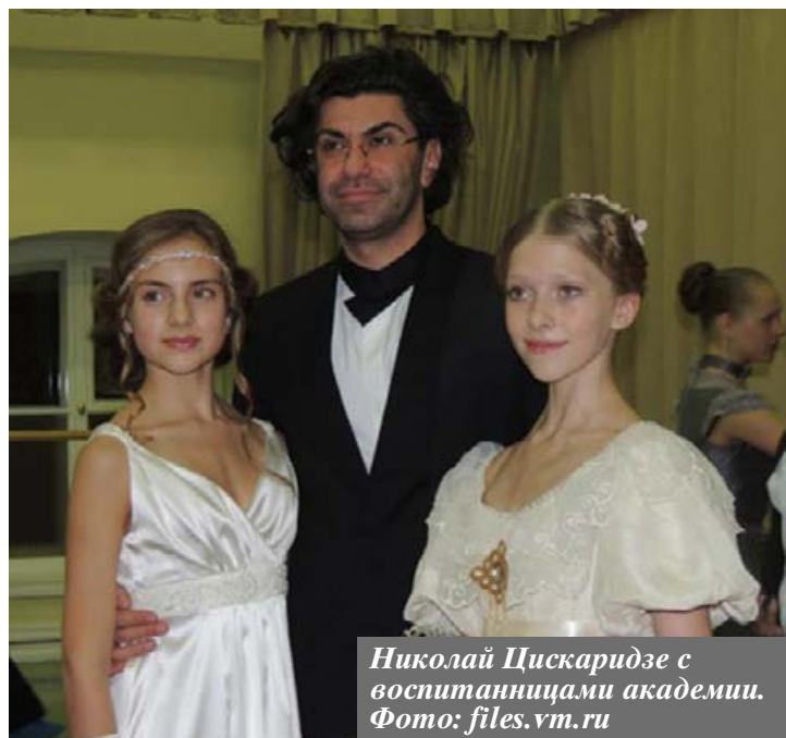
Николай Цискаридзе с воспитанницами академии.

Академия русского балета имени Агриппины Яковлевны Вагановой относится к числу старейших балетных школ в мире. Основана ее в 1738 году императрица Анна Иоанновна, и более 270 лет академия держала планку одной из лучших вплоть до новейшего периода своей истории. Не будем касаться общих причин падения уровня преподавания в стране, они