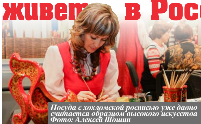
Посуда с хохломской росписью уже давно считается образцом высокого искусства

фестиваль «Жар-птица» свои изделия привозят мастера из 65 регионов страны - от Камчатки до Калининграда.