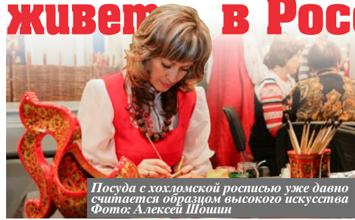
Посуда с хохломской росписью уже давно считается образцом высокого искусства

фестиваль «Жар-птица» свои изделия привозят мастера из 65 регионов страны - от Камчатки до Калининграда.