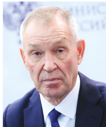
Г.А. ДРОЖЖИН Президент Ассоциации «Народные художественные промыслы России», Академик Российской Академии художеств