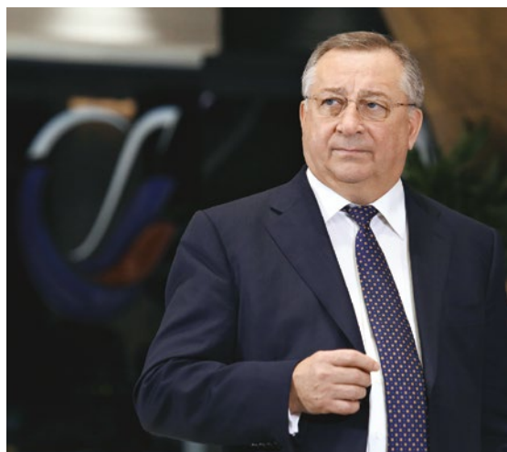
Н.П. Токарев Президент ПАО «Транснефть»